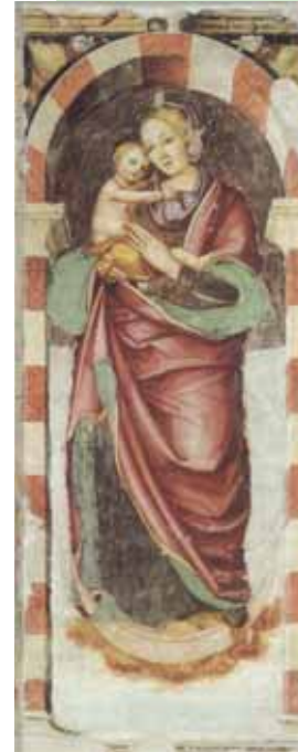
Giovanni Antonio Pordenone, Madonna con il bambino , avanti il 1506. Pilastro di destra Duomo di San Marco, Pordenone

Il nostro Seminario è stato costruito e continua a vivere grazie ai lasciti che tante buone persone hanno voluto devolvere a favore dell'opera educativa del Seminario, che da più di 70 anni nella sede di Pordenone, ha formato generazioni di giovani al senso di umanità nello spirito del cristianesimo. Chiunque volesse contribuire anche economicamente per sostenere il Seminario può farlo o tramite Conto corrente postale n. 10960599, oppure attraverso bonifico bancario alla Banca Popolare Friuladria CIN V, CAB 12508; ABI 05336 sul C/C 26500/83. Ringraziamo sentitamente quanti manifesteranno l'affetto per i seminaristi anche attraverso l'aiuto economico.